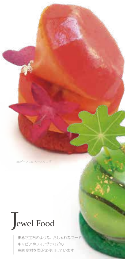
赤ピーマンのムースリング