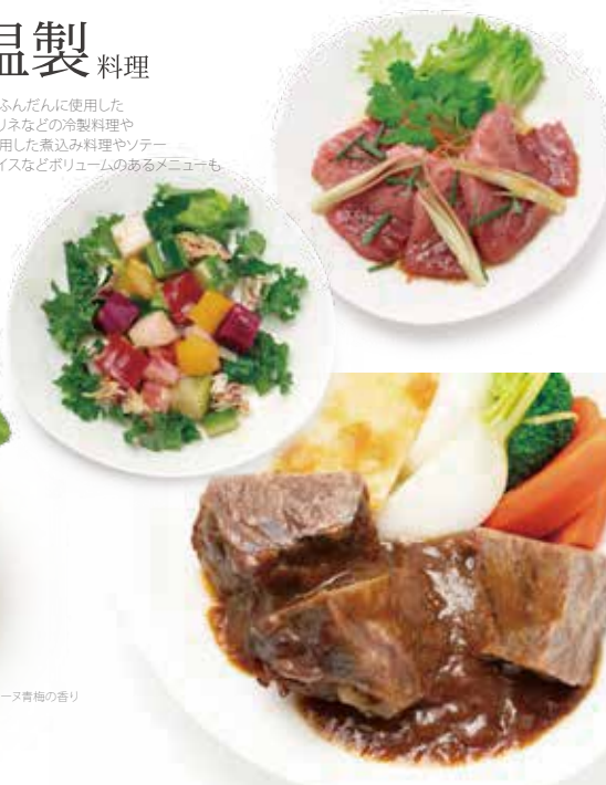
フォアグラのテリーヌ青梅の香り

旬の素材をふんだんに使用した サラダやマリネなどの冷製料理や 肉や魚を使用した煮込み料理やソテー ペンネやライスなどボリュームのあるメニューも