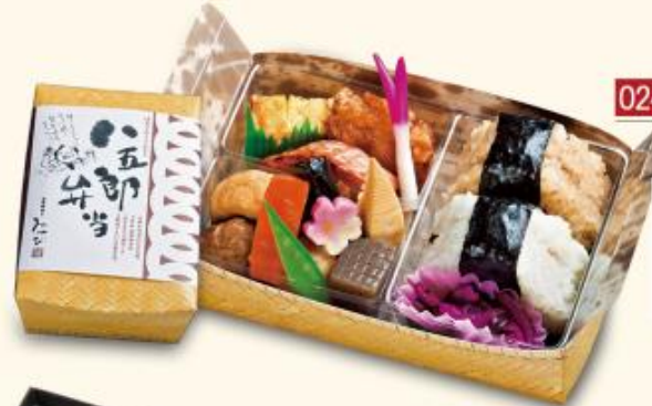
はちごろうべんとう 024 八五郎弁当 880 円 【180×110×75mm】 特定原材料