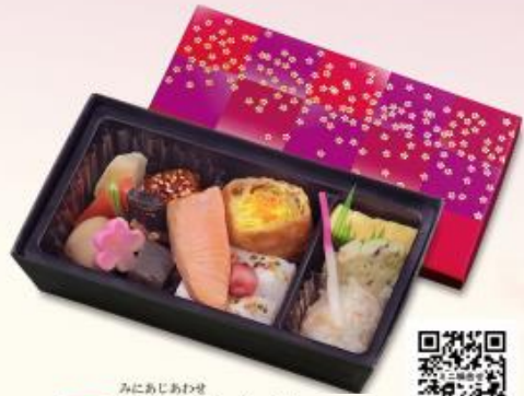
140 ミニ味合せ 880円 【190×105×40mm】 特定原材料