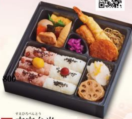
009 末広弁当 880円 【195×195×45mm】 特定原材料