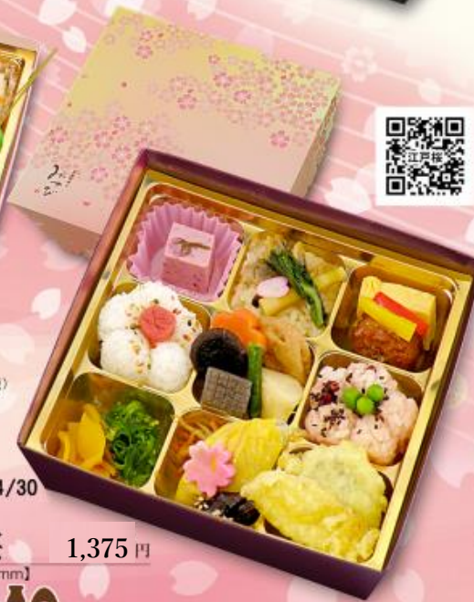
季節限定 3/1~4/30 506 江戸桜 1,375円 【198×198×50mm】 特定原材料