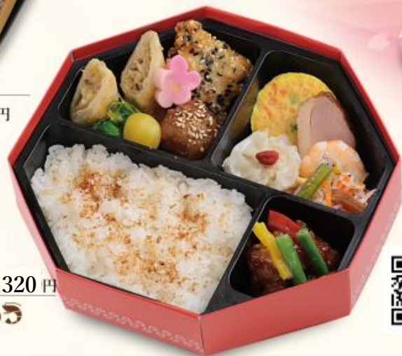
743 彩り中華弁当 1,320円 【190×190×50mm】 特定原材料