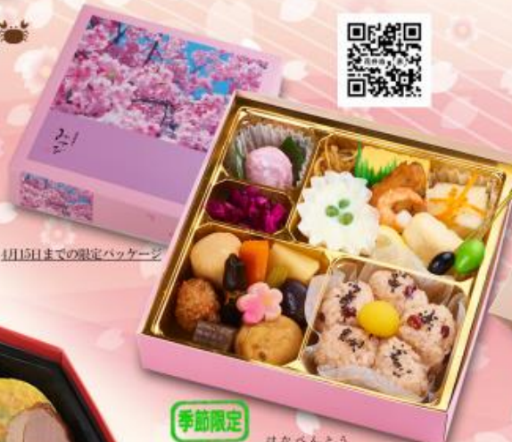
季節限定 008 花卉当 1,320円 【198×198×50mm】(白飯・赤飯選択可能) 特定原材料