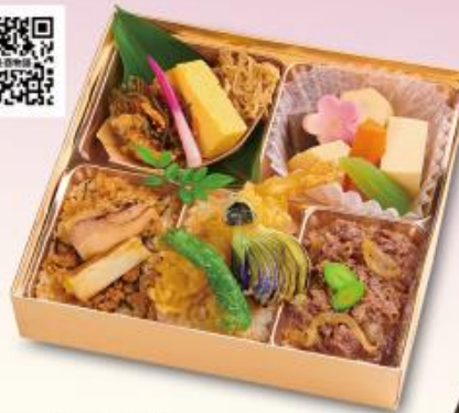
563 天・丑酉物語 1,100円 【175×175×42mm】 特定原材料