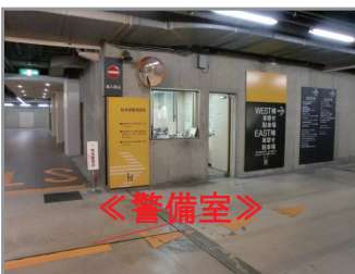
▼警備員に行き先をお伝えください