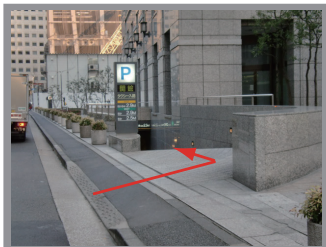
▼駐車場へお入りください