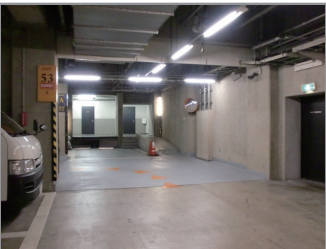
▼地下3階 荷捌き場に到着です