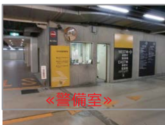
▼警備員に行き先をお伝えください