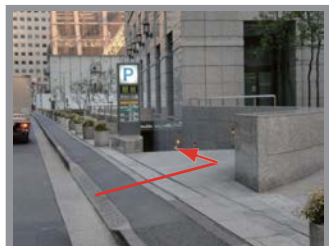
▼駐車場へお入りください