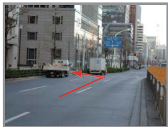
▼当ビルと大手町ビルの間を左折